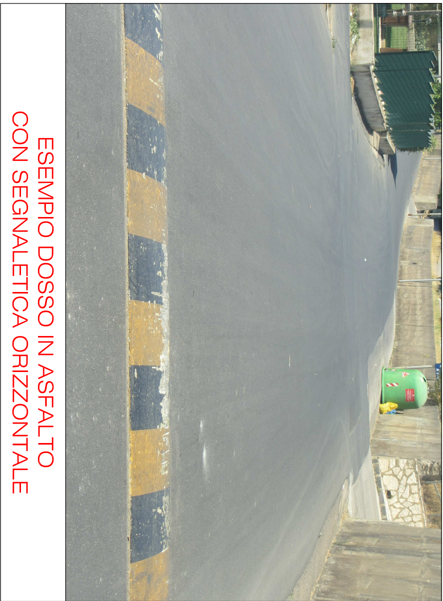
ESEMPIO DOSSO IN ASFALTO CON SEGNALETICA ORIZZONTALE