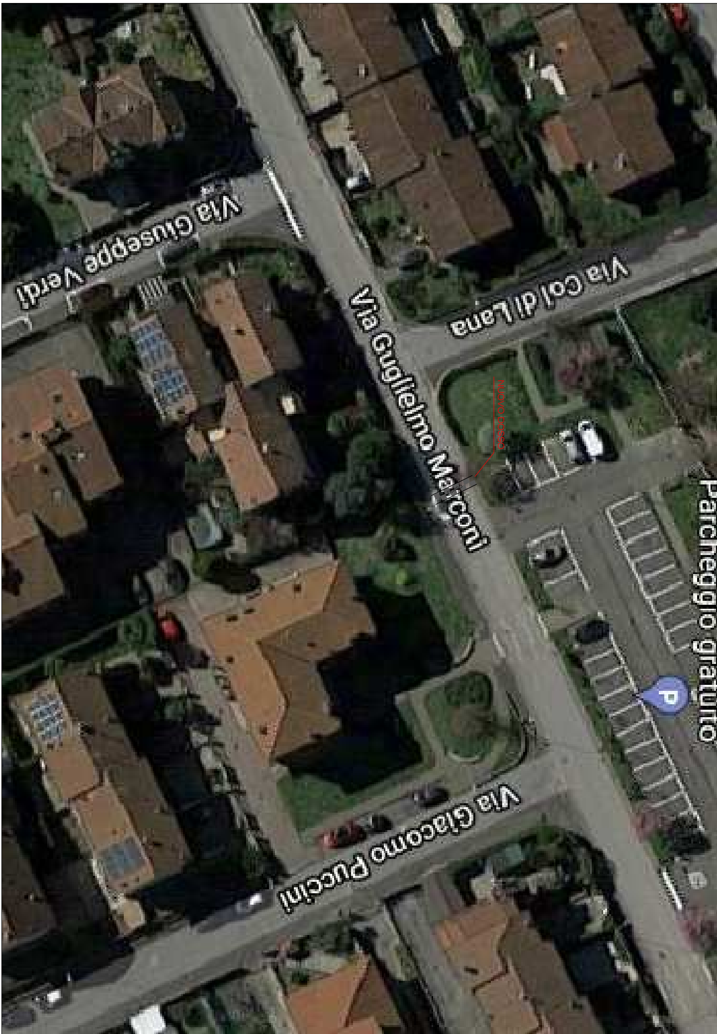
PLANIMETRIA VIA GUGLIELMO MARCONI SCALA 1:500